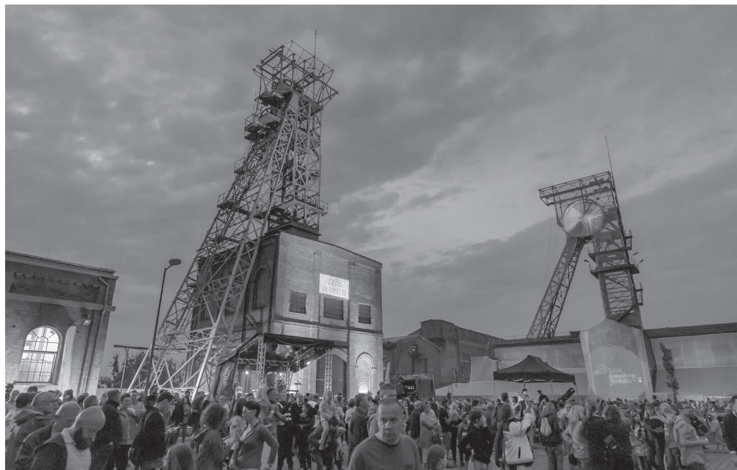
Zabytkowa Kopalnia Ignacy w Rybniku

Raz jeszcze wysoką ocenę wystawiają INDUSTRIADZIE uczestnicy tegorocznego święta Szlaku Zabytków Techniki. Z deklaracji badanych uczestników wynika, że ponad 80.000 osób już teraz zakłada swoją obecność podczas kolejnej edycji festiwalu.